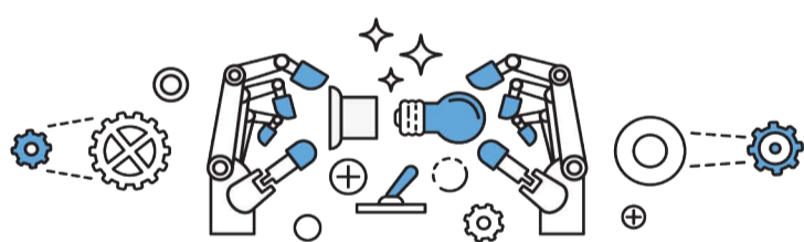
Montagem e controlo de um robot

Com efeito, os parceiros encontram-se a ultimar pormenores em relação à produção destes dois primeiros módulos intitulados: